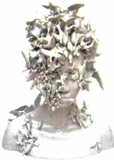
Juliette Clovis. Busto di donna in porcellana di Limoges.