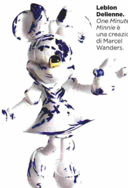
Leblon Delienne. One Minute Minnie è una creazione di Marcel Wanders.