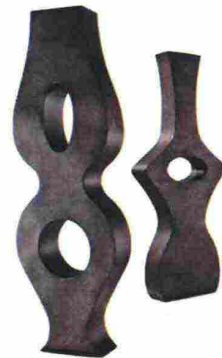
DeCastelli. Tristan&Isotte , in corten, sono di Stefano Dussin.