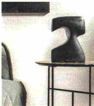
Gardeco. Freyr , scultura bronzea dell' islandese Örn Porsteinnsson.