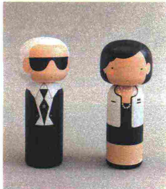
Lucie Kaas. Bambole Kokeshi ispirate alle icone della moda.