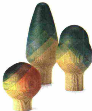
Vitra. Herringbone Trees : alberi in legno colorati per immersione.