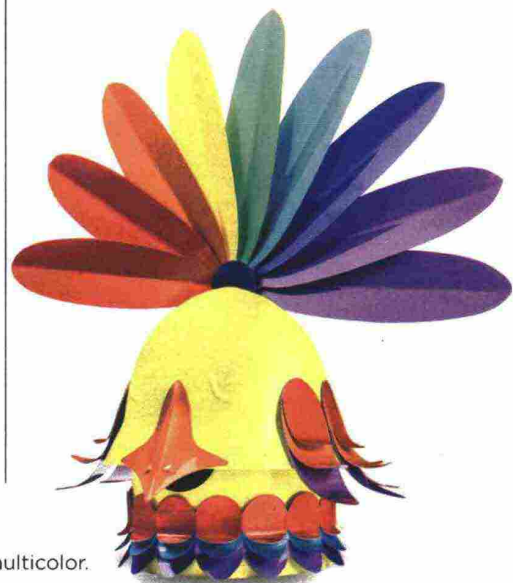
Altreforme. Gallo , in alluminio multicolor.