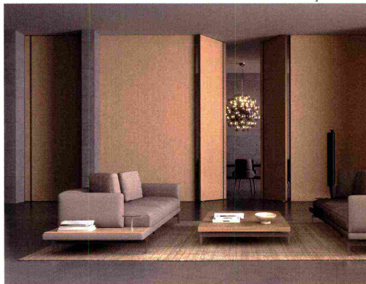
In alto, Metalsphere collection in collaborazione con De Castelli porta rivestita in Ottone DeMarea e maniglia Luminova. Qui sopra, Continuity, il sistema sartoriale di Barausse che integra soluzioni di chiusura con rivestimenti boiserie ed elementi di arredo. Nella pagina accanto: in alto, Dressed Up, il sistema di partizione pivotante su progetto, Metalsphere collection in collaborazione con De Castelli . In basso, partizione in vetro e alluminio con sistema di apertura pieghevole.

Ritaglio stampa ad uso esclusivo del destinatario, non riproducibile.