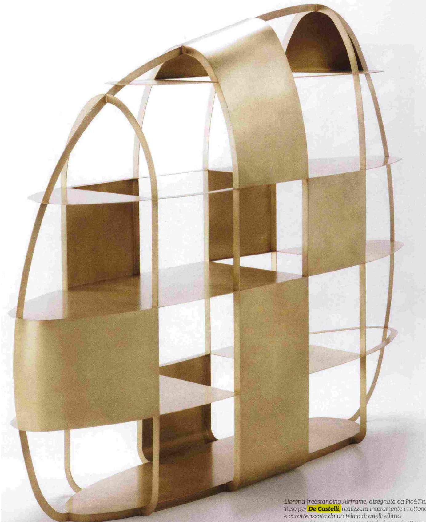
Libreria freestanding Airframe, disegnata da Pio&Tito Toso per De Castelli , realizzata interamente in ottone e caratterizzata da un telaio di anelli ellittici asimmetrici parzialmente rivestiti da lastre di ottone martellato a mano.

Ritaglio stampa ad uso esclusivo del destinatario, non riproducibile.