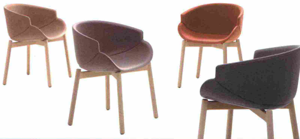
Sedute BIX , Zanellato / Bortotto, B-Line, 2018