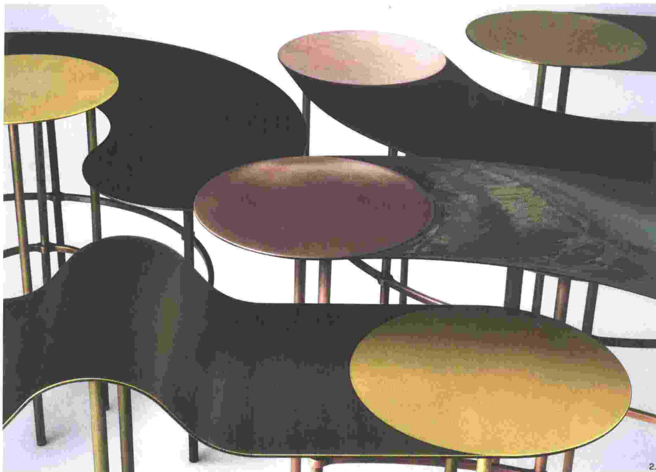
2 — Scribble, ensemble de tables basses/family of coffee tables, De Castelli

Cette prise de conscience a ouvert de nouveaux horizons à ces deux designers, qui travaillent entre l'Italie et Singapour. Tous deux considèrent que le design a un rôle à jouer dans « le vieillissement de la population, les soins de santé, les nouveaux concepts de propriété, les nouveaux services et les concepts d'entreprises pour faciliter la vie des infatigables habitants de l'Asie. » Inspiré par le degré d'information, le goût du voyage et l'ouverture d'esprit de la population asiatique, le tandem Lanzavecchia + Wai ressent le besoin de participer à des projets qui exigent des idées neuves et un travail de re-contextualisation.