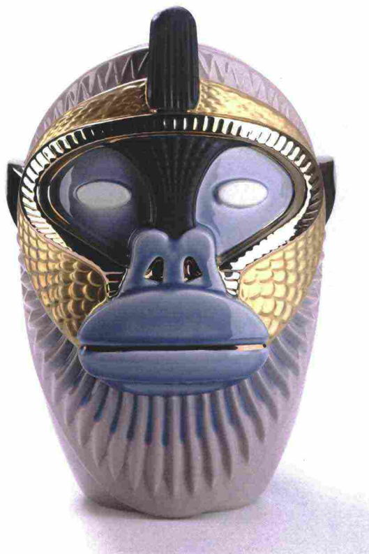
In questa pagina, Collezione Primates di vasi in ceramica per Bosa.

Nella pagina a sinistra, in alto: Insieme Most Illustrious Bosa Ceramiche Elena Salmistraro. In basso: Reptilian Elena Salmistraro for Moooi carpets.