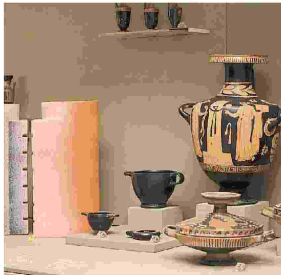
Due immagini della mostra "Past Forward"