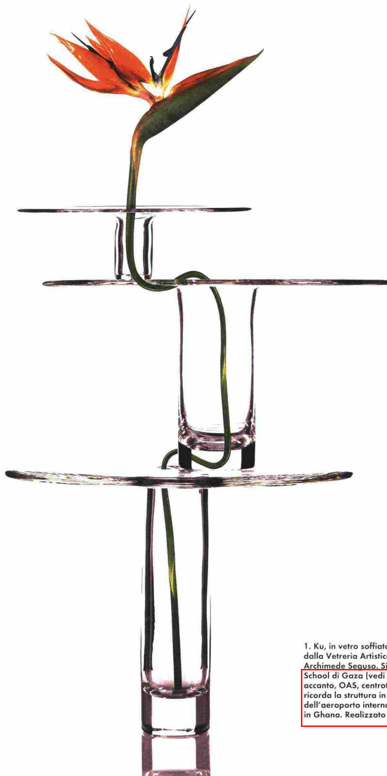
1. Ku, in vetro soffiato il vaso realizzato dalla Vetreria Artistica di Murano Archimede Seguso. Si ispira alla Green School di Gaza (vedi pag. 52). 2. Pagina accanto, OAS, centrotavola in metallo, ricorda la struttura in cemento dell'aeroporto internazionale di Accra, in Ghana. Realizzato da De Castelli.