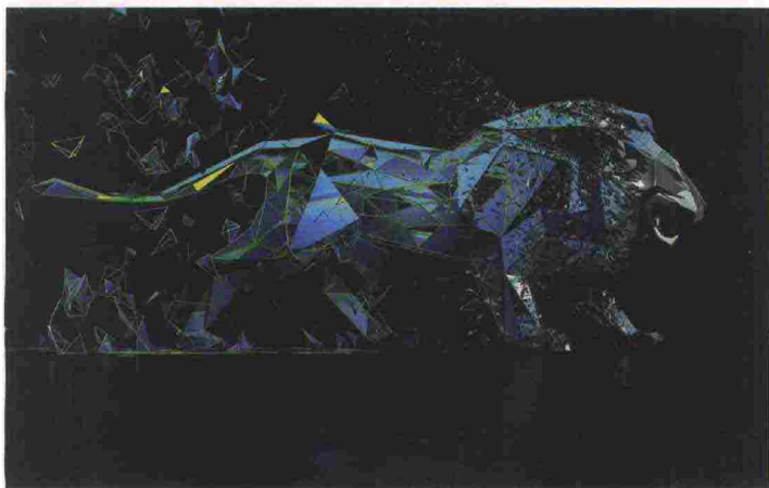
DALL'ALTO, IN SENSO ORARIO, LE CASSETTIERE PANDORA DI DE CASTELLI ; LA CHAISE LONGUE ONDA DI ARMANI CASA, RIVESTITA IN PELLE INTRECCIATA; IL LEONE ILLUMINATO CON LUCI DICROICHE DELL'ALLESTIMENTO UNBORING THE FUTURE DI PEUGEOT E LE NUOVE POLTRONE DI FENDI CASA DALL'ALLURE ROMANTICA E IL DESIGN CIRCOLARE