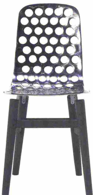
Next di Gervasoni. Macro fori caratterizzano questa seduta in fusione di alluminio, con telaio in rovere grigio. gervasoni1882.com