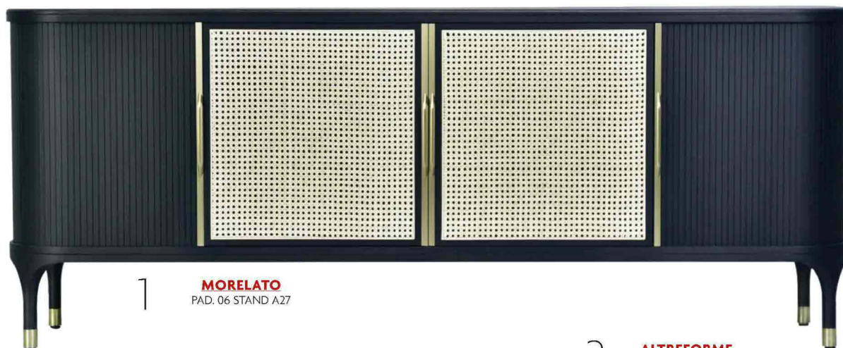
1 MORELATO PAD. 06 STAND A27