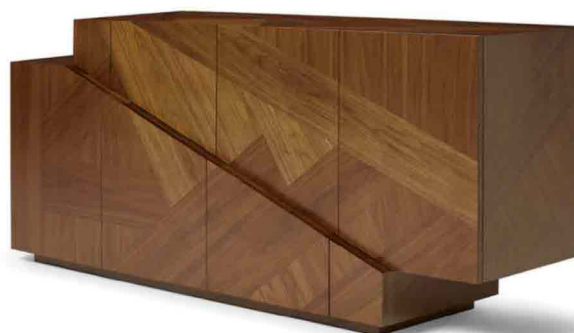
DE CASTELLI PAD. 22 STAND C37-39