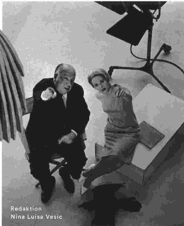
Redaktion Nina Luisa Vesic