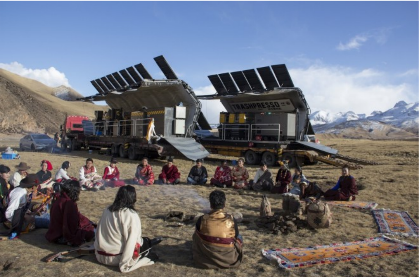
La piattaforma mobile Trashpresso by Miniwiz, in Tibet