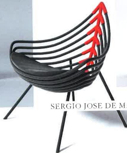
SERGIO JOSE DE MATOS

Die Salone Satellite Permanent Collection kann im Legnoarredo Trainingscenter in Lentate sul Seveso (IT) besucht werden. www.salonemilano.it