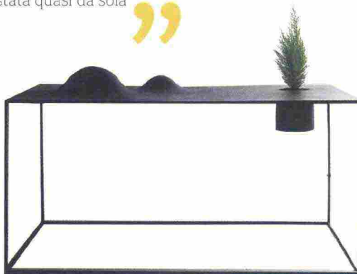
2009 Pocket Landscapes DE CASTELLI