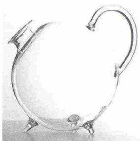
2000 Piggy PAOLA C.